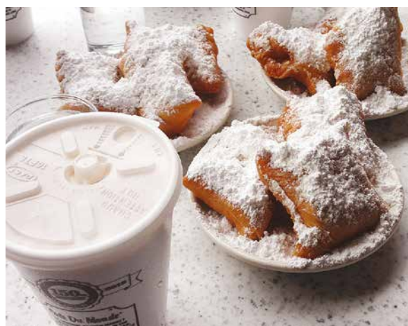
図 4. Café Du Monde のベニエ

学会参加以外のことを少しお伝えします。Café Du Monde のNew Orleans 本店に行ってきました。ベニエという、砂糖を大量につけて食べるドーナツ様のものですが、見た目ほどしつこい甘さではなく、とても美味しかったです。私は日本にも支店があるのを知らず、Café Du Monde のコーヒー豆の缶詰