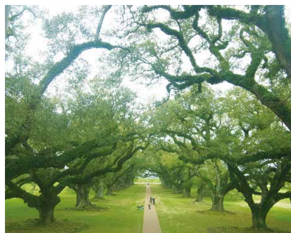
図 5. プランテーションツアーで領主の館から撮影

今回、初めての海外学会で、どれも新鮮で、有意義な時間を過ごせました。先生方には御指導いただき、深く感謝しております。これからも、ポスター発表や口演での発表ができるように、精進していきたいと思います。御指導、御鞭撻の程、よろしくお願い致します。