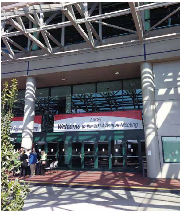
図1. AAOS 会場の入り口

ORSではポスター発表を行いました。行きの飛行機で、ロストバゲージについて何も考えずに、ポスターをスーツケースの中に入れて預けてしまっていたのですが、預けた荷物は無事に受け取ることができて、ポスター展示を行うことができました。